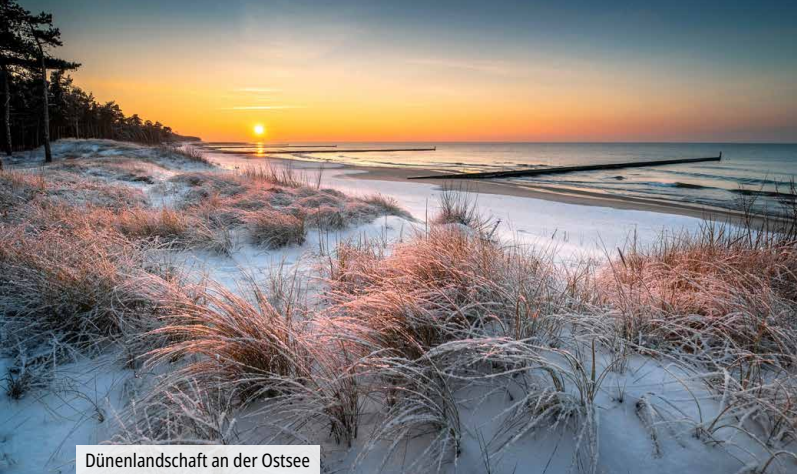
Dünenlandschaft an der Ostsee