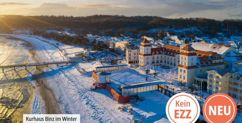
Kurhaus Binz im Winter