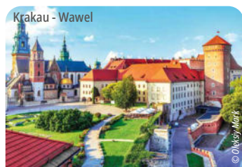
Krakau - Wawel

Kraków zählt zu den schönsten Städten Europas. Bei einer Stadtrundfahrt mit Rundgang (ca. 3h) erkunden Sie den prächtigen Marktplatz, die Jagiellonen-Universität sowie die Marienkirche (Außenbesichtigungen). Nach der Führung haben Sie Zeit für einen individuellen Bummel. Lohnenswert ist die Besichtigung vom Schloss Wawel (Eintritt Extrakosten, ca. 10 €).