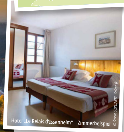
Hotel „Le Relais d'Issenheim“ – Zimmerbeispiel