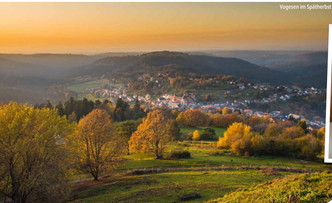
Vogesen im Spätherbst

Malerische Fachwerkhäuser in Colmar und entlang der Weinstraße • Weinprobe und rustikales Mittagessen • Die ballonförmigen Gipfel der Vogesen