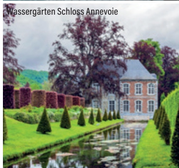
Wassergärten Schloss Annevoie