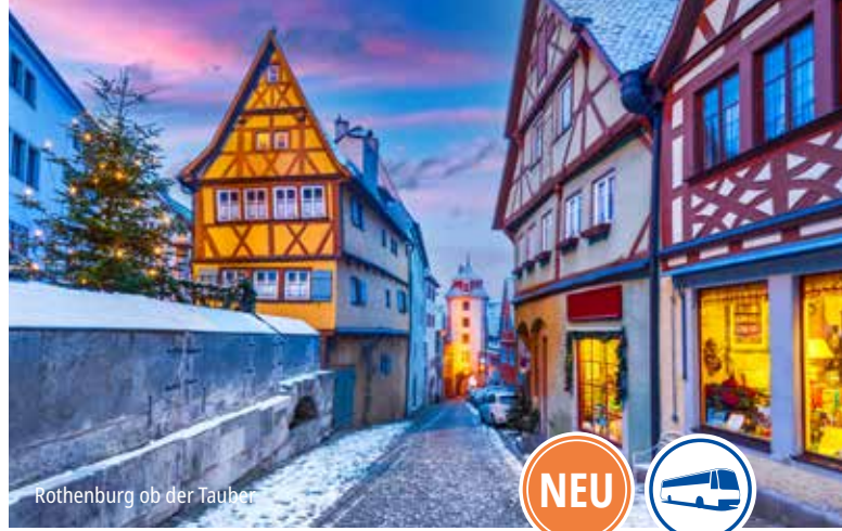
Rothenburg ob der Tauber

Hinweise: Sonstige Eintrittsgelder sowie Kurtaxe sind nicht im Reisepreis enthalten. MTZ: 25 bei einer Absagefrist bis 4 Wochen vor Reisebeginn.